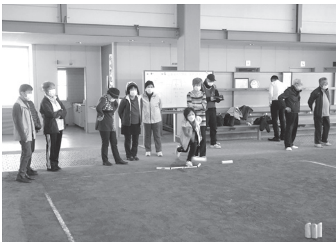
ふれあいサロン活動支援事業 ネット講座「モルツク体験」(左頁1-①)