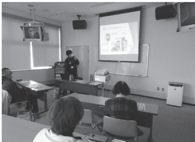
ひきこもり支援サポーター養成講座(左頁2-③)