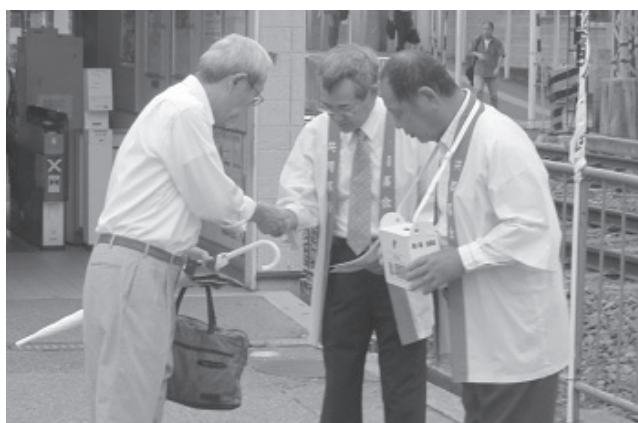
近鉄結崎駅前の街頭募金活動（10月3日実施）