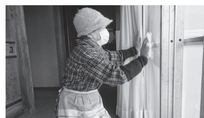
住民ボランティアによる大掃除の様子

申込をされた皆さんからは「気持ちよく新年が迎えられます」と、喜びの声が聞かれました。