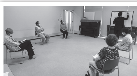
各団体から様々な意見がだされました

次回に向けては、感染予防に関する不安や疑問の意見が多く出たことから、「感染予防策」をテーマに「第3回ふれあいサロン活動 担当者 交流会」を開催する予定です。