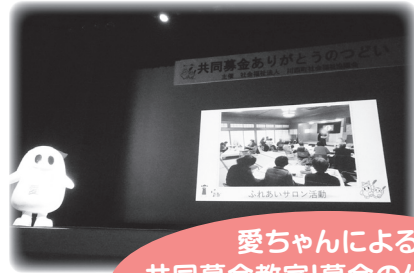
愛ちゃんによる 共同募金教室!募金の仕組みや 活用方法をお伝えいたしました

次回のつどいは令和5年9月9日に開催予定です。 是非皆さまのご参加お待ちしております。