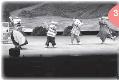
3びきのこぶたショーは大盛り上がり