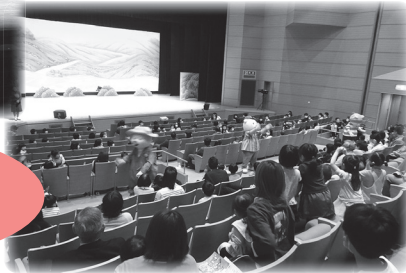
沢山の方に ご参加頂きました!