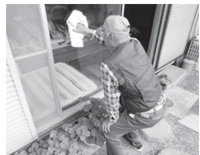
住民ボランティアによる大掃除の様子