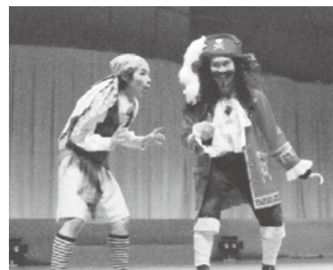
劇団 WEST 近畿一円の幼稚園、学校、イベント会場、大ホール で公演活動を行っている大阪のミュージカル劇団

「ふれあい」「支えあい」のまちづくりを目指して、さまざまな世代の方々がともにつどい、共同募金のしくみや町内の福祉活動がわかる楽しいイベントです!!