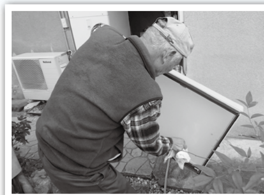
住民ボランティアによる大掃除の様子

申込をされた皆さんからは「気持ちよく新年が迎えられます」と、喜んでいただきました。