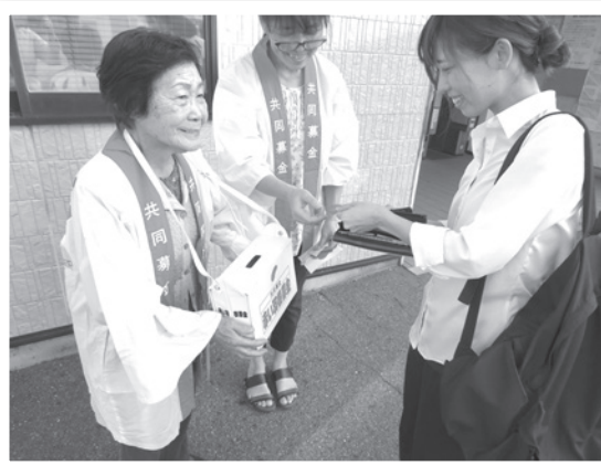
近鉄結崎駅前の街頭募金活動(10月1日実施)